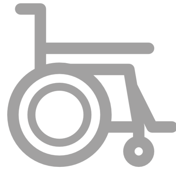
специальные технические средства